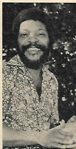
Martinho da Vila

Martinho da Vila, no momento, está sonhando dia e noite, um sonho sonhado, magnetizado.